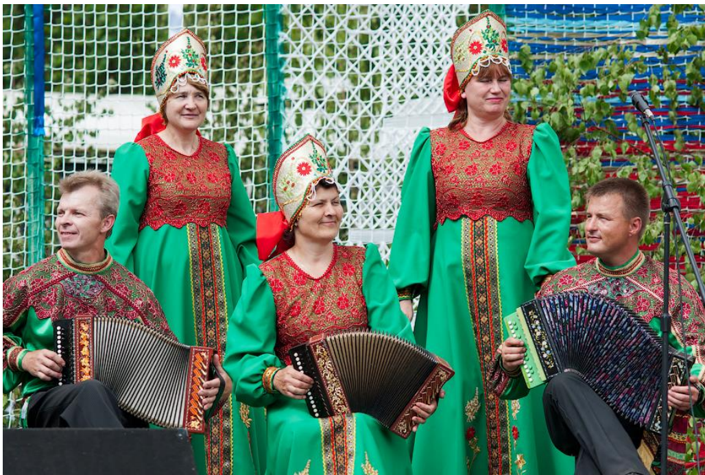
Троицкие хороводы в Орловском Полесье – 2011 – ансамбль «Ливенские гармошки».