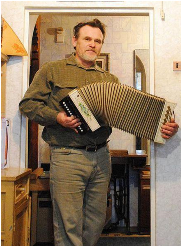
Гармонь Ливенка из экспозиции дачи-музея Михаила Раската