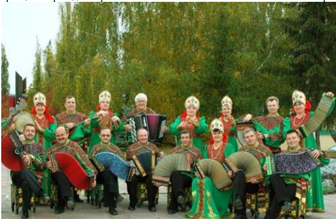
Инструментальный ансамбль «Ливенские гармошки» первым в регионе получил звание «Заслуженный коллектив народного творчества Орловской области».